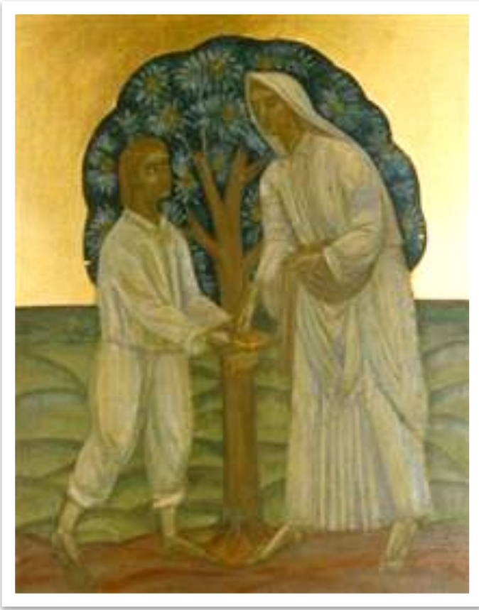
Двоє під деревом. Микола Бойчук (1882-1937)